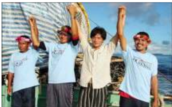
Los tres pescadores mexicanos levantan los brazos junto a un miembro de la tripulación del atunero taiwanés que los rescató cerca de Australia.

Los pescadores habían echado una red, pero los fuertes vientos la rompieron. Entonces, por la noche salieron a buscar la línea hasta que el combustible de los motores se les acabó y el viento los llevó mar adentro. Quedaron así a merced de los fuertes vientos del Pacífico.